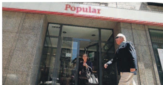
Una oficina del Banco Popular de la calle Uría, en una imagen de archivo.